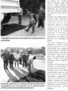
El alcalde Francisco Héctor Treviño Cantú, acompañado por diversos funcionarios municipales, inaugura la aplicación de asfalto en un racho del municipio.

El alcalde Francisco Héctor Treviño Cantú, acompañado por diversos funcionarios municipales, inauguró la aplicación de asfalto en un racho del municipio.