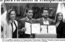
El alcalde Francisco Héctor Treviño Cantú, acompañado por representantes de la COTAI, firma un convenio de colaboración para fortalecer la transparencia y el acceso a la información pública en el municipio de Juárez.

El alcalde Francisco Héctor Treviño Cantú, firmó un convenio de colaboración con la Comisión de Transparencia y Acceso a la Información Pública (COTAI) del Estado de Nuevo León. Este convenio tiene como objetivo fortalecer la transparencia y el acceso a la información pública en el municipio de Juárez. El alcalde mencionó que este convenio permitirá mejorar los procesos de gestión municipal y garantizar que la información pública sea accesible y transparente para todos los ciudadanos.