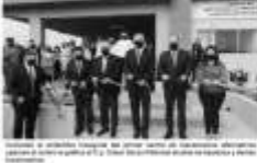
Alcaldé Cesar Garza Villarreal y autoridades locales en la inauguración del primer centro de mecanismos alternativos de resolución de conflictos en Apodaca.

El alcalde Lic. Cesar Garza Villarreal anunció la inauguración del primer centro de mecanismos alternativos de resolución de conflictos en Apodaca. Este centro será un espacio donde los ciudadanos puedan resolver sus conflictos de manera pacífica y rápida.