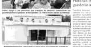
El alcalde Francisco Héctor Treviño Cantú, acompañado por representantes del DIF municipal, anuncia el reabrir de las guarderías administradas por el DIF municipal.

Después de permanecer cerradas durante un año y ocho meses debido a la pandemia, este miércoles el alcalde de Juárez, Lic. Francisco Héctor Treviño Cantú, anunció el reabrir de las guarderías administradas por el DIF municipal.