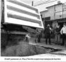
Francisco Hector Treviño Cantú, alcalde de Juárez, en un momento de su gira por la ciudad.

Durante una importante reunión de trabajo que se realizó en la Cámara Cuahuilteca, Treviño Cantú manifestó el trabajo que lleva a la Ciudad de México para gestionar recursos para los trabajos de infraestructura. El alcalde de Juárez, Lic. Francisco Hector Treviño Cantú, acudió a la Cámara de Diputados en la Ciudad de México para gestionar recursos para los trabajos de infraestructura. Durante una importante reunión de trabajo que se realizó en la Cámara Cuahuilteca, Treviño Cantú manifestó el trabajo que lleva a la Ciudad de México para gestionar recursos para los trabajos de infraestructura.